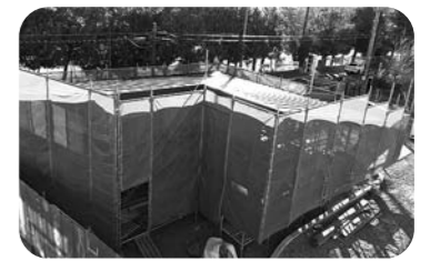
完成間近!地域交流棟「オンテラス」