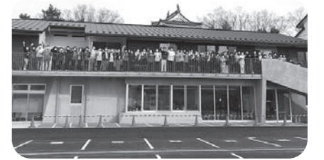
ワンチームでがんばります!