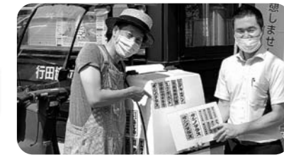
「甲冑隊」メンバーさんがバイクにオシノテラス