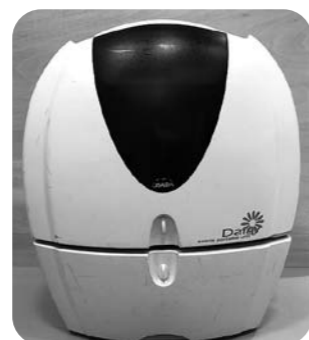
訪問治療用ユニット