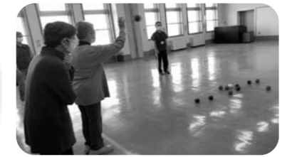
見沼支部で「ポッチャ」体験