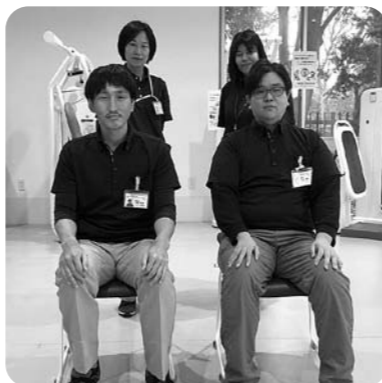
理学療法士も2名体制 約100名が利用するデイケアに

職員の体制も充実してきています。今年のたびくらは、理学療法士2名体制となり、介護職員や送迎運転手についても、「利用者様の自立した生活を支援できるような一員」として、レベルアップしていくことを目標にしています。