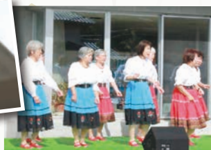
華やかなフォークダンスさくら