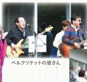
ベルクリケットの皆さん