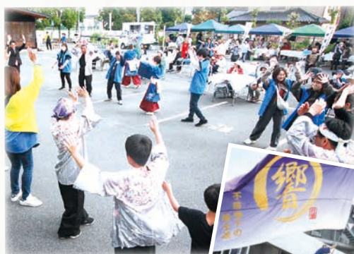
忍藩鳴子會 響(ひびき)の皆さん 地元でよさこい踊り8量の大旗を 振ります最後は会場の皆で総踊り！